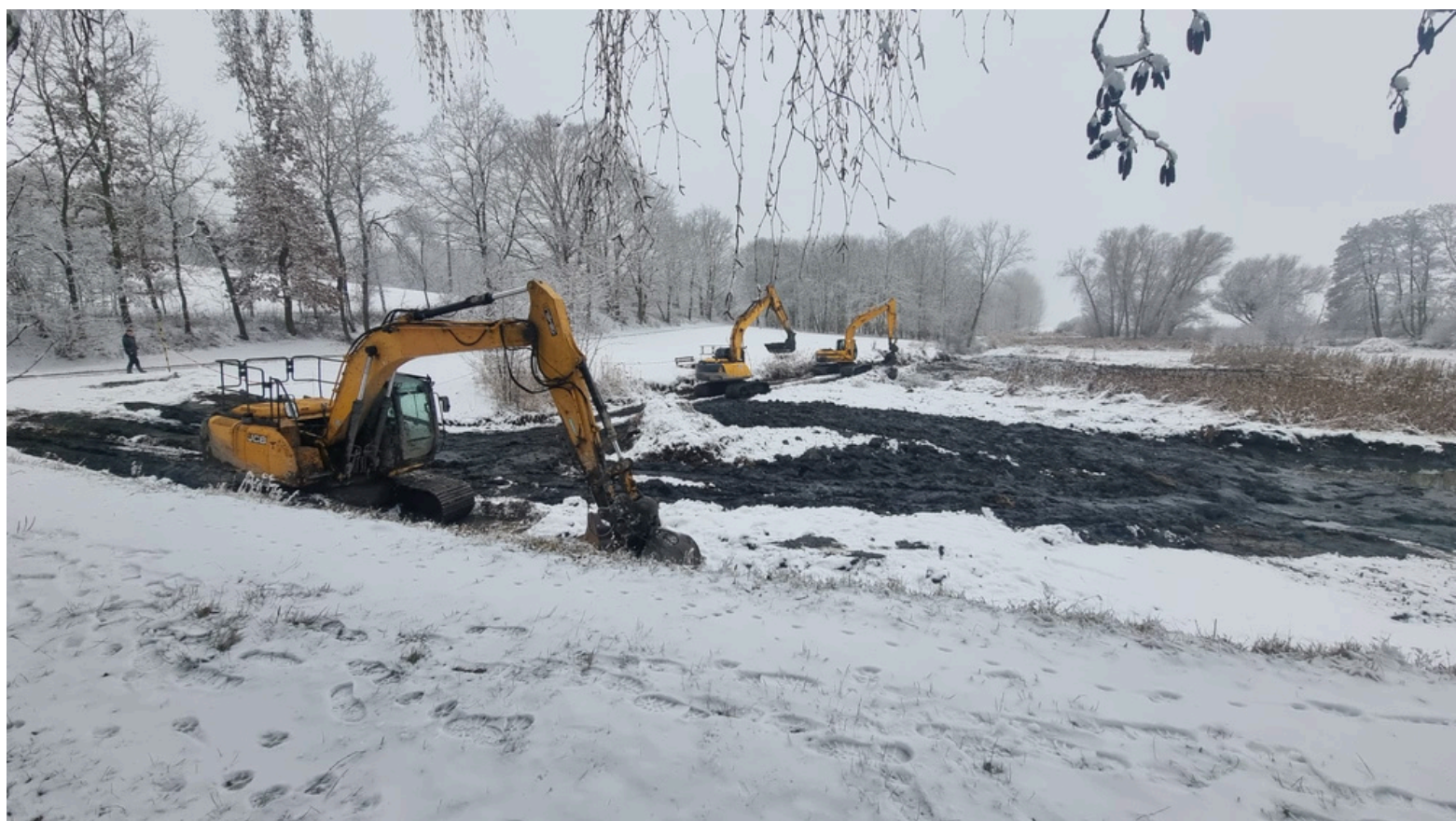
Na snímku vidíte okamžik ze zasněžené planiny. Ve skutečnosti jde o náš rybník Hrádek. Těžká technika nám pomáhá proměnit jeho neutěšený stav v opět příjemné místo, kde se bude dařit rybám a zájemci se zde v létě třeba i vykoupají, až přijde teplé počasí.