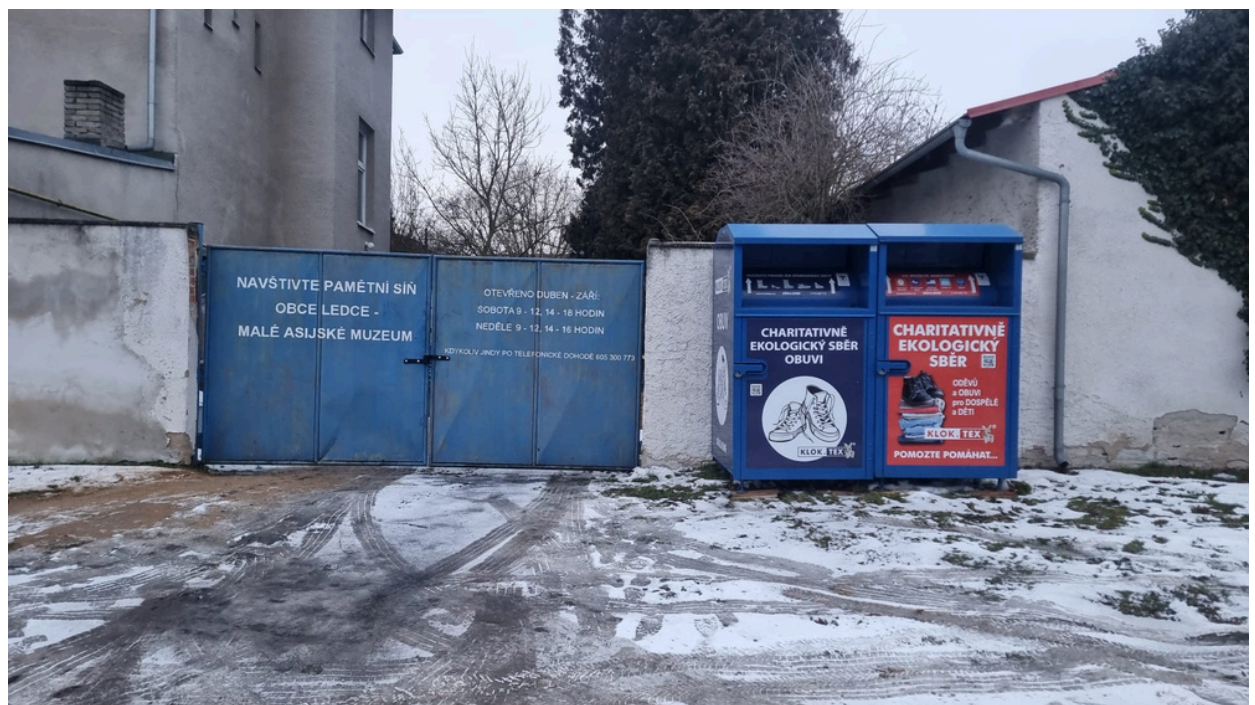
Na tomto místě, u budovy muzea z boční strany, se nachází kontejner na textil. Slouží k ukládání použitého oblečení a dalších textilních věcí, které mohou být dále využity.

Bio odpad lze ukládat do kontejneru u hřbitova a na jaře bude trvale přistavený kontejner na obvyklém místě ve Šternberku.